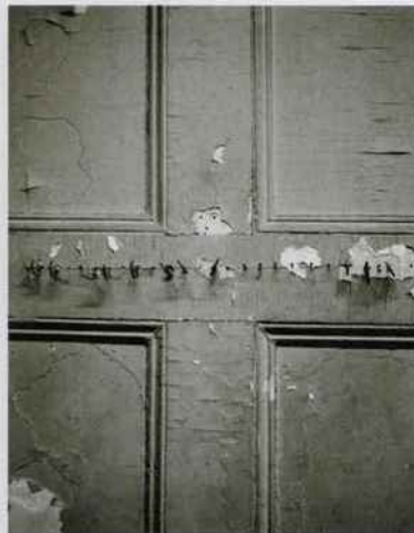
La maison-atelier de Louise Bourgeois à New York, 2014